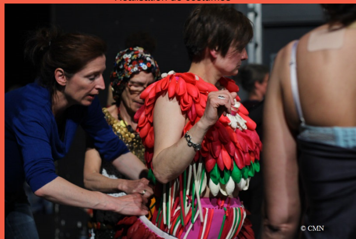
Réalisation de costumes

Le projet s'est développé autour de trois thématiques complémentaires : les costumes, les coutumes et la mode. Les costumes ont été présentés dans le cadre d'une exposition au château de Champs-sur-Marne.