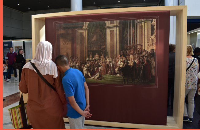
Exposition au centre commercial "Beau Sevran"

" Beaucoup de gens considèrent à tort que ce musée n'est pas fait pour eux. C'est faux. C'est un lieu qui appartient à tout le monde. Et pour le prouver, nous leur proposons d'emmener un petit bout du Louvre chez eux. " Jean-Luc Martinez, président-directeur du musée du Louvre.