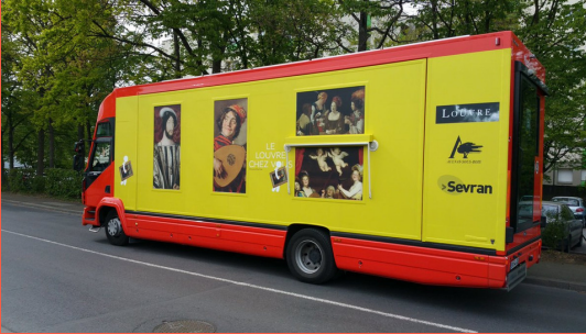
Camion itinérant de prêt de reproductions d'oeuvres"