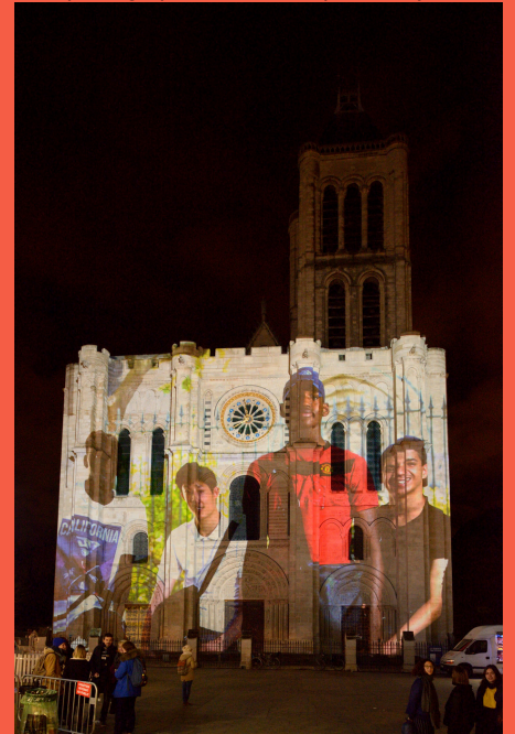
Projection des photographies réalisées par les Dionysiens